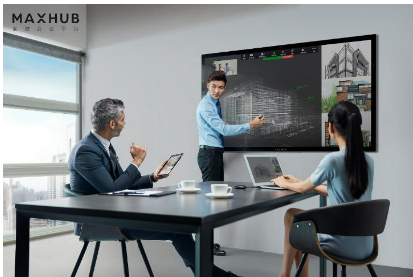
图7：MAXHUB交互智能平板产品