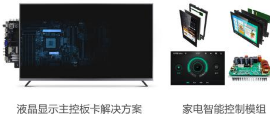
图1：部件业务主要产品