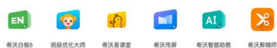
图5：希沃常态化应用软件产品