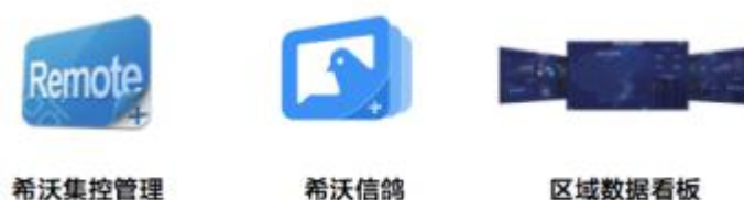
图6：希沃数据管理与服务产品

为助力学校实现校园应用场景的全面信息化管理，希沃开发了数据管理与服务应用软件，主要为希沃集控管理软件、希沃信鸽、区域数据看板等产品，旨在辅助教学管理决策，助力教学优化。