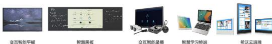
图4：希沃数字化硬件产品

交互智能平板是教育数字化环境硬件的核心产品，又称交互式液晶一体机，是以高清或超高清液晶屏显示，集Windows、Android双系统一体设计，可实现系统间数据互传共享，白板书写、演示和多种格式的多媒体课件播放，教育应用商城SeewoStore资源开放共享，具有强兼容性、响应速度快、低辐射，低功耗的特点。除此之外，数字化环境硬件产品还包括智慧黑板、交互智能录播、希沃云班牌、智慧学习终端等。