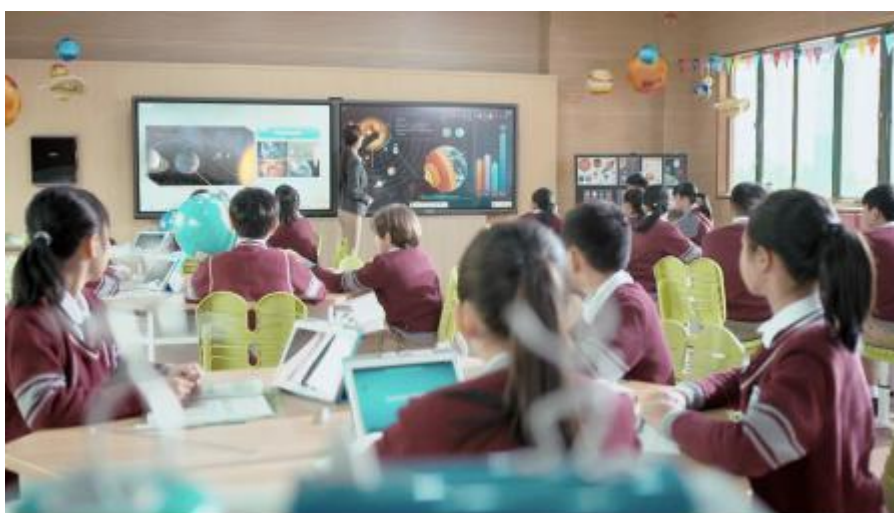
图2：希沃教学应用场景

希沃提供的教育信息化应用工具主要分为三大类产品：数字化环境硬件、常态化应用软件、数据管理与服务软件。这些工具围绕“教师、教室、教学”，从教室应用场景，向学校、学区的完整教育信息化应用场景延伸，基于同一账号体系，打通了各个底层模块数据，能够实现教学小数据的静默采集，从而通过呈现、分析教学小数据，辅助教学管理决策，助力教学优化，帮助教师发展。